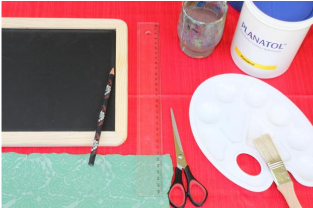
Diese Materialien werden benötigt