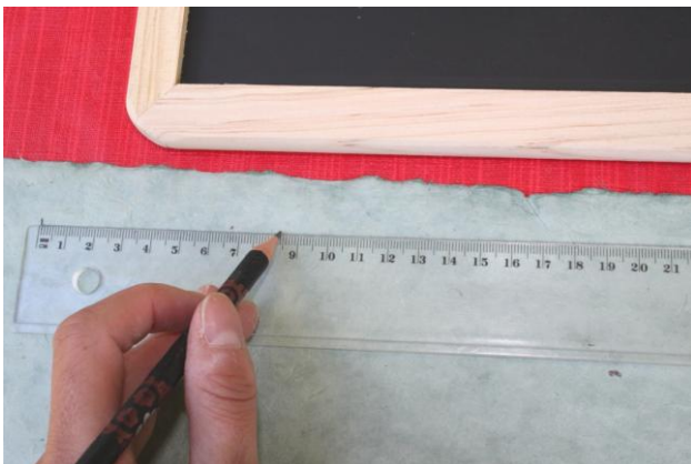
Dann mißt man Länge und Breite ab