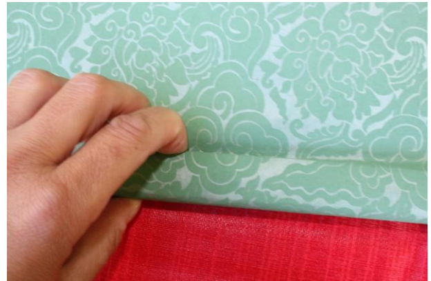
Zuerst mißt man die benötigte Papiergröße ungefähr ab, indem man das Papier am Rahmen anhält. Der Rahmen sollte überstehend bedeckt sein